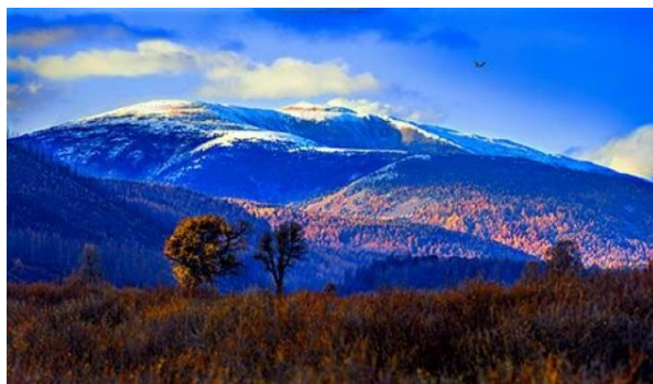
ジンギスカンが定期的に祈っていた ブルハン・ハルドウン山

テングリは蒙古族の至上神であり、同時に天を意味する。そのテングリの命によって蒼き狼（Borte Chono）であるモンゴル族の祖先が生まれ、その9代目がジンギスカンとされる。相撲取りの白鳳の着物にはこの狼をあしらったものがある。宗教はシャーマニズムに基づいており宇宙との調和の中に生きる。