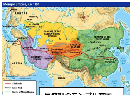
最盛期のモンゴル帝国

ジンギスカン（1162～1227）は1206年、モンゴル平原の遊牧民の部族を束ねて、中央アジアと中国を支配した。彼の後継者たちは、さらに領土を広げ、ポーランド、シリア、ベトナム、朝鮮に侵攻、1100～1200万平方マイルに及ぶ大帝国を作った。この侵略で多くの人々が虐殺されたが、彼は従うものには信仰の自由を与え、拷問を廃止、交易を奨励し、最初の国際的郵便制度を創った。