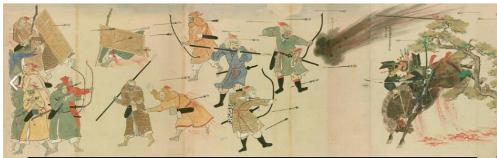
モンゴル軍の襲撃に立ち向かう日本の侍（右側）（蒙古襲来絵詞より）

モンゴルの歴史と日本との関わり ジンギスカンの孫、クビライカンは 1266 年、2 度にわたり日本国王宛に国書を送ったが日本側は返事を返さなかった。そこで、モンゴル軍は 1274 年と 1281 年、2 度にわたり日本を襲った。